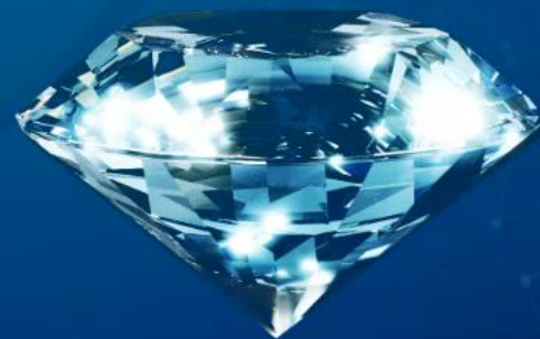
Blue monsanit 0,5 ct