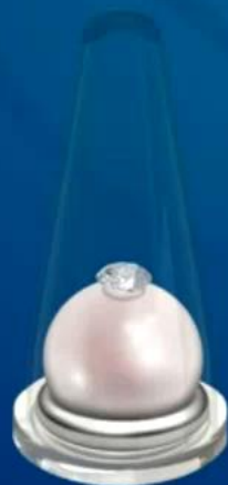
Brylant 0,01 ct