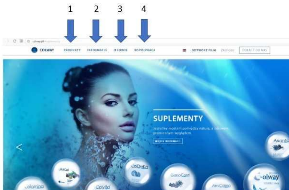
Rys. 1. Główna witryna COLWAY – www.colway.pl

W tym rozdziale omówimy poszczególne zakładki na stronie www.colway.pl.